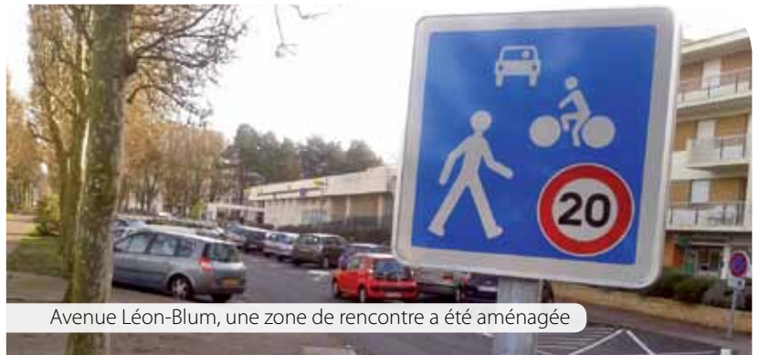
Avenue Léon-Blum, une zone de rencontre a été aménagée

Blum, donne la priorité absolue aux piétons et aux cyclistes dans une moindre mesure. Dans une logique de partage de l'espace par les différents usagers, la vitesse des véhicules est limitée à 20km/h. Pour la sécurité de tous.